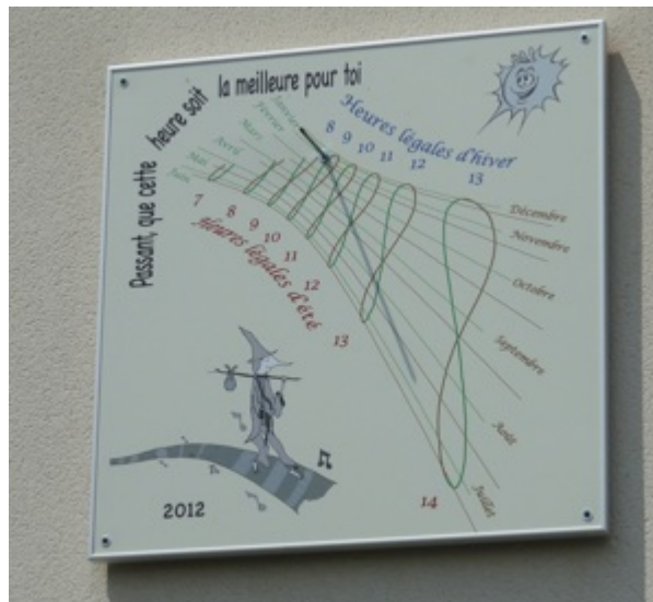
Fig. 1 : Le cadran solaire de mon domicile

Le site web explique notamment que selon la période de l'année, il faut ne considérer que les lignes horaires et les arcs de déclinaison d'une couleur donnée : vert du Solstice d'hiver à celui d'été, et marron pour le reste de l'année. Il explique également que si l'on est en période d'heures d'été il faut lire l'heure à l'aide des chiffres en rouge et inversement utiliser les chiffres en bleu si ce sont les heures d'hiver qui sont utilisés (Fig. 2).